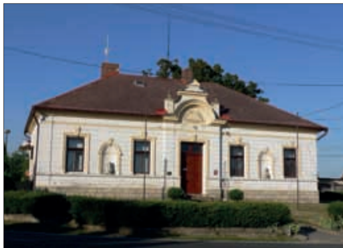
Obecní úřad Ptýrov sídlí v osadě Braňka

Relaxuji nejraději sportem, běháním, plaváním, lyžováním, ale také nepohrdnu pěknou knížkou.