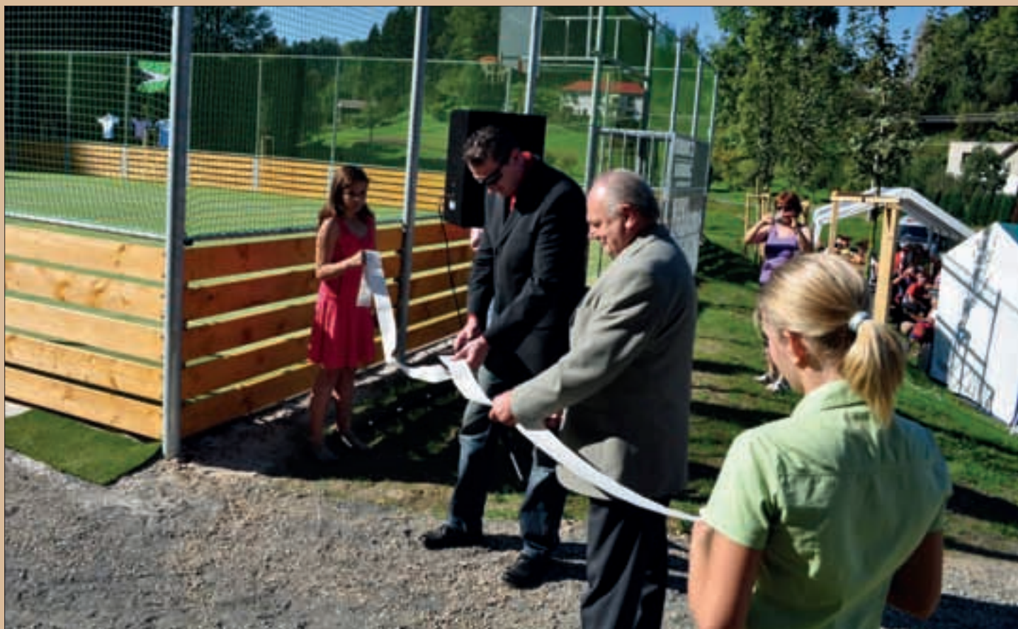
Slavnostní otevření víceúčelového hřiště v Kacanovech

Odborná exkurze – příklady dobré praxe OSA I, III a IV PRV, ukázka projektů realizovaných v MAS Libereckého kraje, pokračovala třetí částí 25. 10. 2011 na území naší obecně prospěšné společnosti. K prezentaci jsme vybrali dva dokončené projekty.