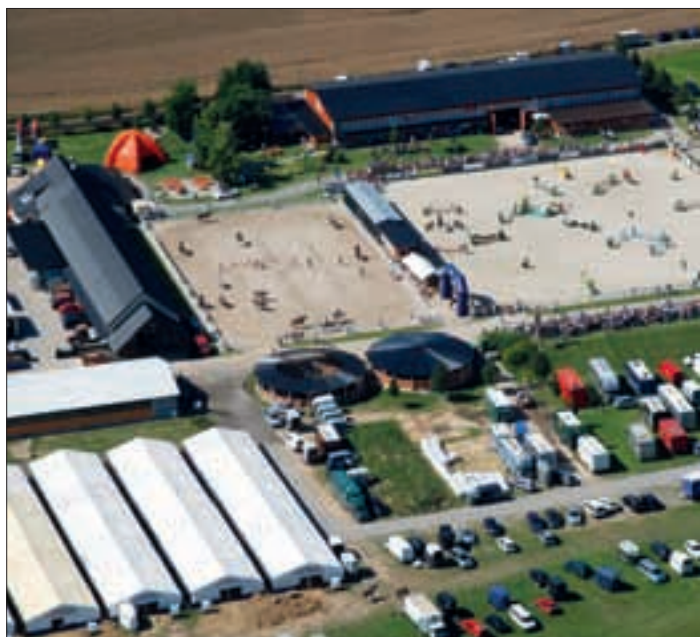
Jezdecký areál Farma PCT Ptýrov