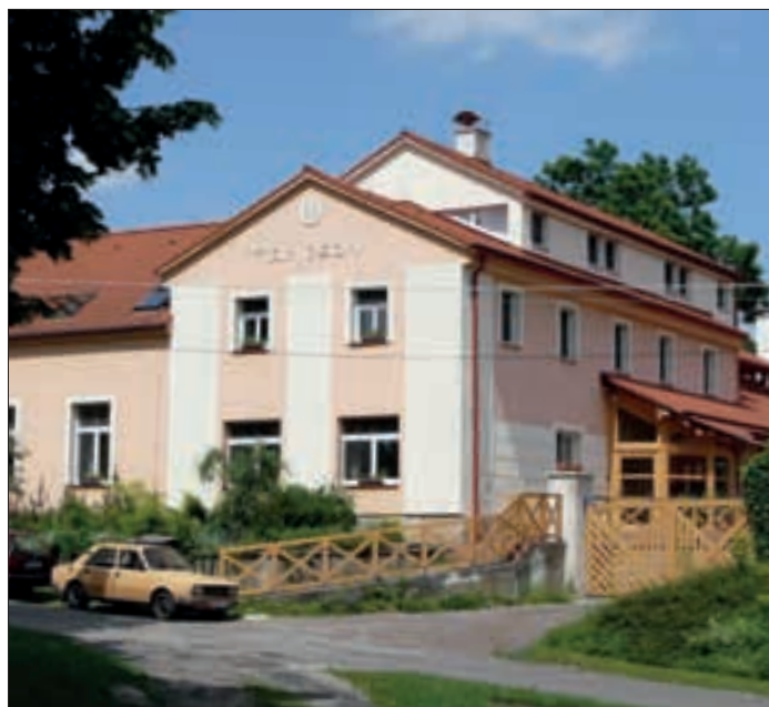
Hampson, Institut pro zrychlené učení v Ptýrově

AP: K náročné funkci starostky potřebuje zvláště žena dobré rodinné zázemí. Je těžké skloubit roli maminky, manželky a starostky?