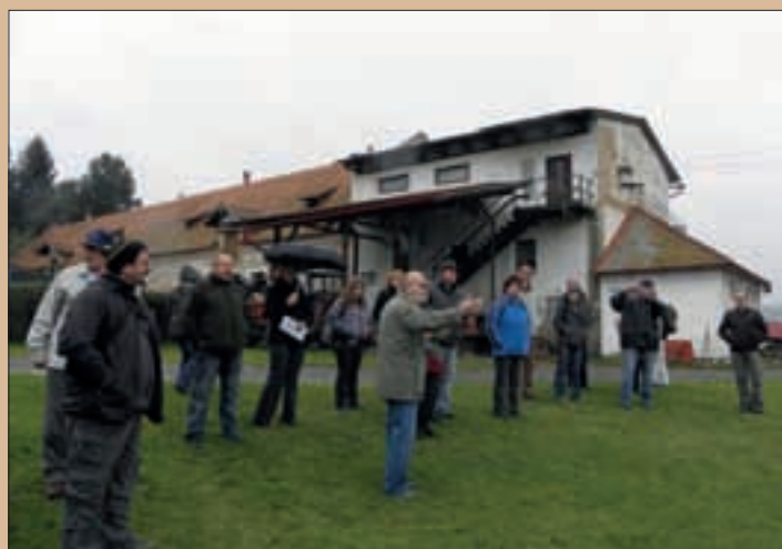
Účastníci exkurze na návštěvě v Borčicích

Také těmto žadatelům děkujeme za umožnění návštěvy jejich realizovaných projektů.